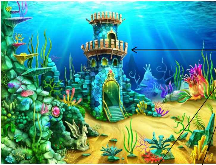
Схема композиции в листе: