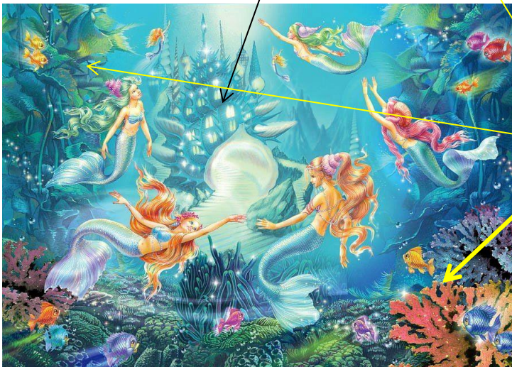
Схема композиции в листе:

Края заполняют обитатели подводного мира