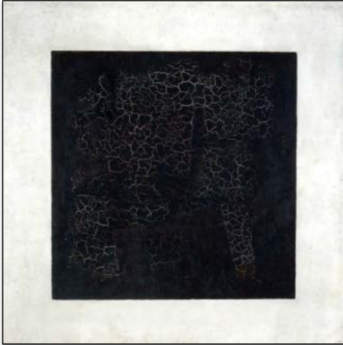
К. С. Малевич «Чёрный квадрат»

Описывая картину необходимо пересказать и то, что именно изображено (денотативное прочтение - обозначающее), а также те мысли или чувства, которые хотел передать автор (коннотативное прочтение – дополнение к основному значению).