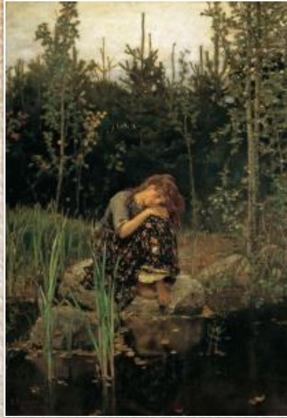
В.М. Васнецов «Алёнушка»

В библиотеке или интернете найти описание картины В.М. Васнецова «Алёнушка». Проанализировать описание картины, определить какая часть текста соответствует введению, основной части и заключению, какие выразительные средства живописи и композиции помогли раскрыть содержание картины.