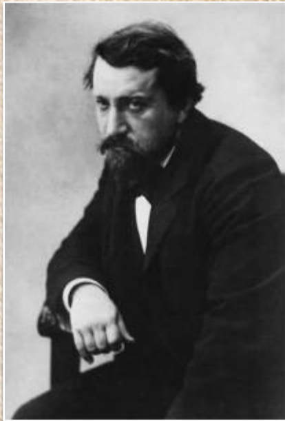
Серов Валентин Александрович (1865 - 1911)

Серов вошел в историю русского искусства как художник исключительной глубины и многосторонности, с блеском испытывшим свои силы почти во всех жанрах живописи и графики. Но высшие его достижения принадлежат области портрета.