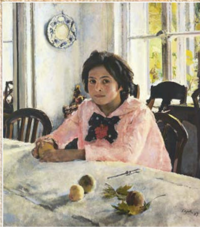
Валентин Александрович Серов «Девочка с персиками»