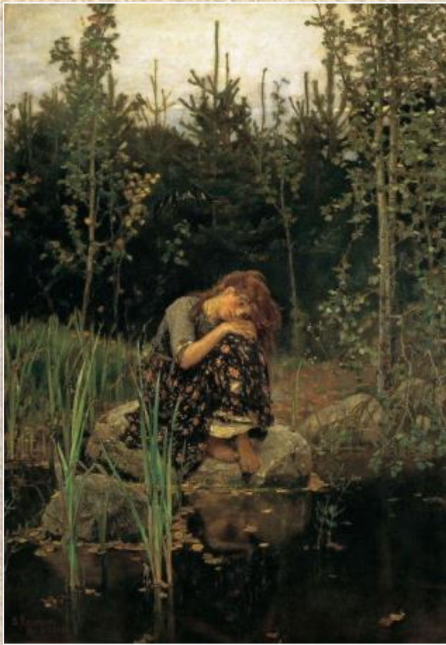
В.М. Васнецов «Алёнушка»