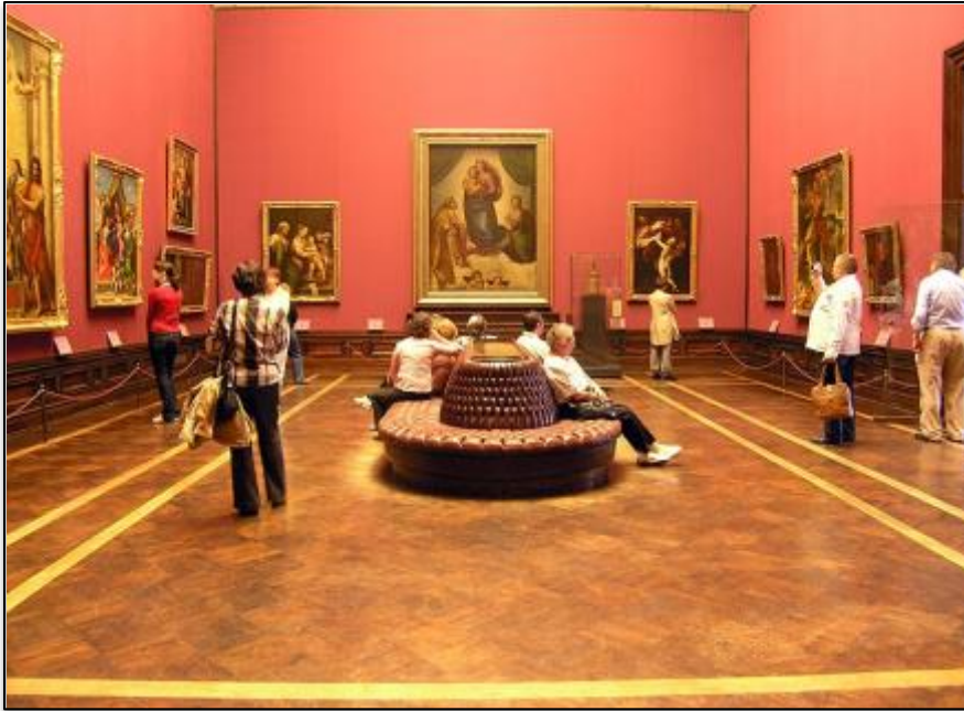
Дрезденская картинная галерея

Посещение выставок музеев, картинных галерей позволяет познакомиться с произведениями искусства. Оттуда зрители возвращаются наполненные идеями и впечатлениями от увиденного.